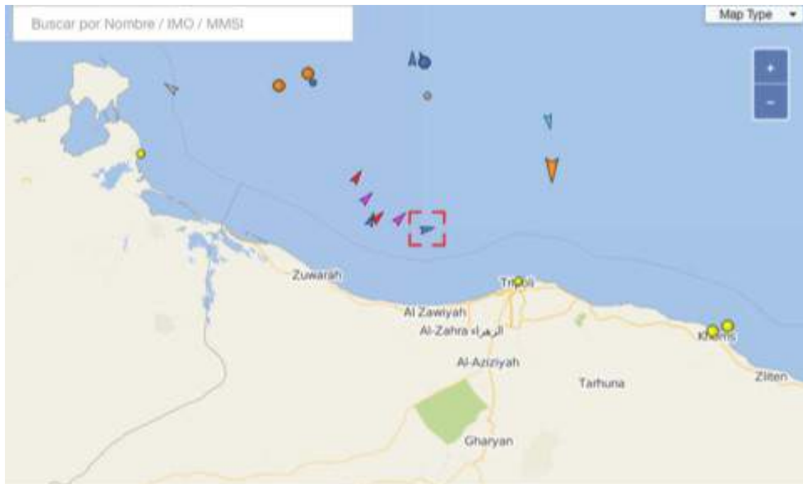
Figura 1 Zona de rastreo a 20 mn de la línea de costa Libia, entre las localidades de Zuwarah y Sabrata (latitud: 33° 45'N y 33° 03'N Longitud: 012° 07'E y 013° 23'E)

Las operaciones se han realizado bajo la coordinación del servicio Guardacostas italiano a través del centro de control (MRCC) de Roma, organismo responsable de coordinar la seguridad en el mar en la zona, subordinándose a sus instrucciones los centros RCC de Malta y SRR Libia.